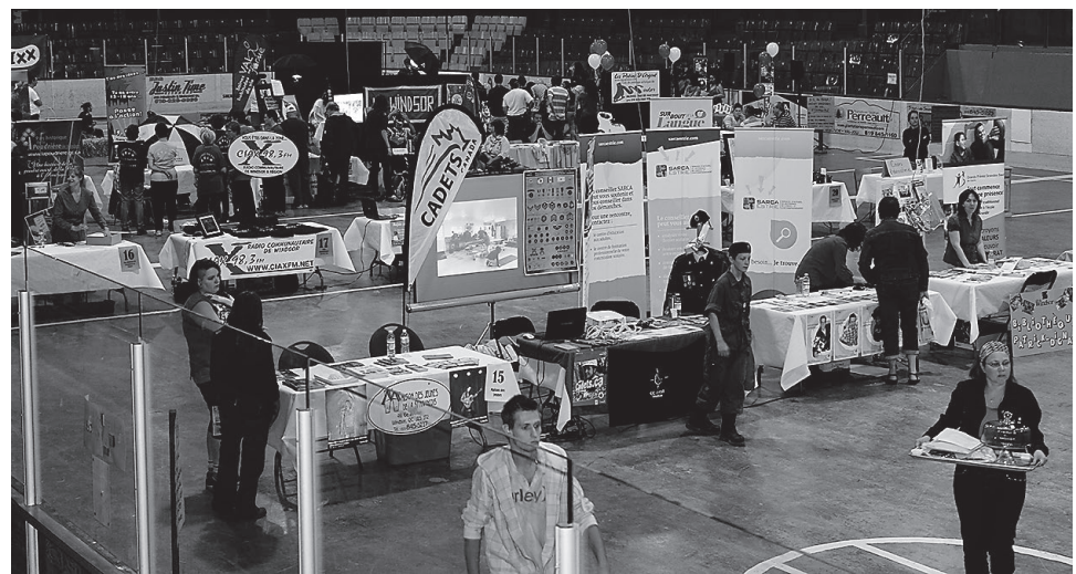
Pour faire suite à la première édition qui se déroulait le 12 août 2014, le Salon loisir des Services récréatifs est de retour le 15 août à l'aréna de Windsor.