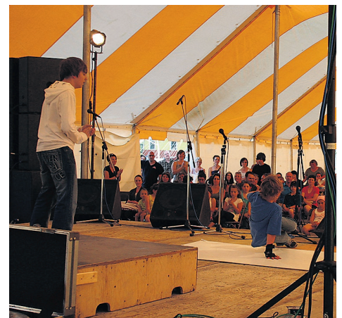
Le « Talent Show » est de retour cette année, cette fois dans le cadre de la Foire commerciale.

Le « Talent Show » s'adresse aux jeunes ainsi qu'aux adultes qui veulent démontrer leurs talents pour la musique, les imitations, l'humour, la danse, la magie et autres aptitudes.