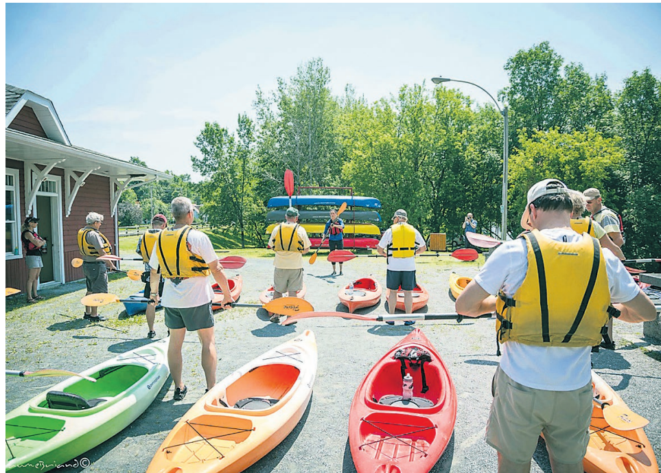
Les participants recevant des conseils d'usage avant leur départ du trajet Richmond-Ulverton.

Source et texte : Parc nautique de Richmond / L'Étincelle (RC).