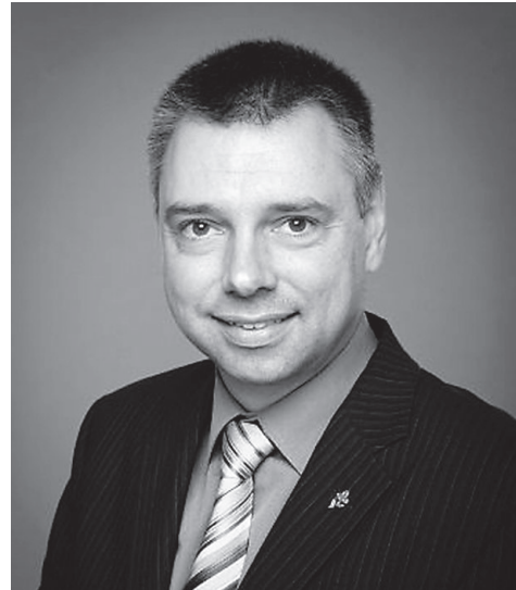
Après quatre mandats consécutifs dans Richmond-Arthabaska, le député bloquiste André Bellavance a choisi de ne pas briguer un autre mandat.

La 42 e législature du Parlement canadien regroupe un total de 11 semaines entamées depuis le dimanche 2 août.